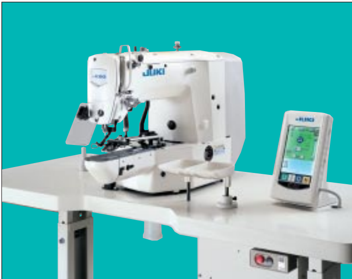
LK-1903ASS-301/IP-200B 裝備(機架臺板是選購件)