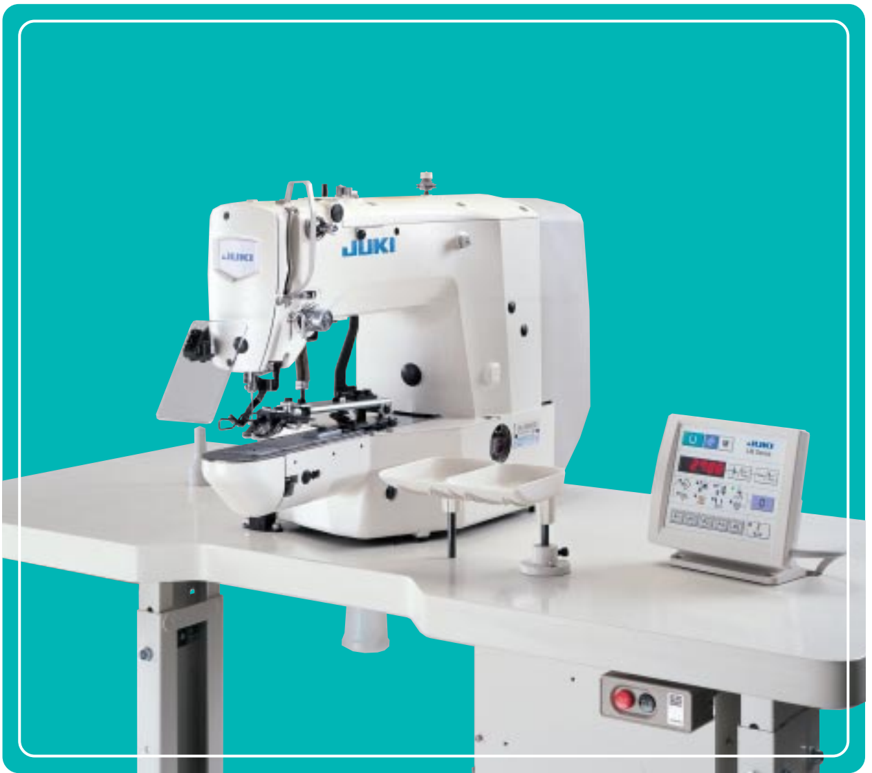
LK-1903ASS-301 (機架臺板是選購件)